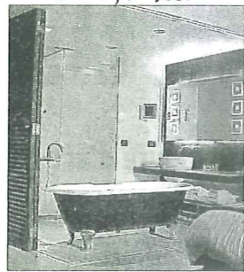
De gauche à droite, le site de production de Miroiterie de Chartreuse à Colombe, Pme qui participe actuellement à l'agencement des chambres de l'Hôtel-Dieu, futur établissement 5 étoiles à Marseille, notamment dans les salles de bains. DR et Agences d'architecture A.BECHU et TANGRAM